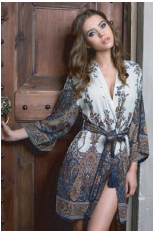
МОДЕЛЬ 16073 S (44) M (46) L (48) XL (50) XXL (52) 100% вискоза