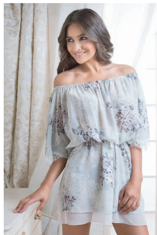
МОДЕЛЬ 17245 S (44) M (46) L (48) 100% полиэстер