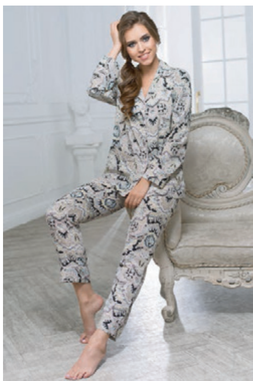
МОДЕЛЬ 17266 S (44) M (46) L (48) 100% полиэстер