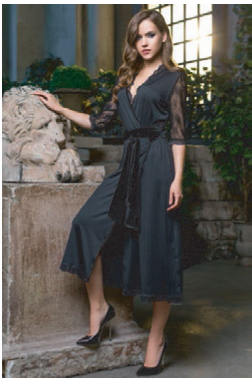
МОДЕЛЬ 12039 M/L (46-48) XL/XXL (50-52) 90% нейлон, 10% эластан